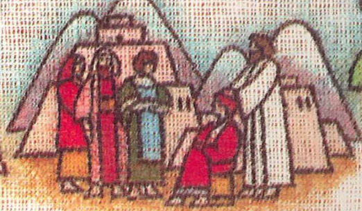
Ri Jesucristo nuya' ri aj chicajel uchuk'a' chique ri yukenela'. (34 juna' chirij pe ri ralaxic ri Cristo)