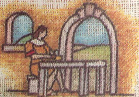
Ri Mormon nitz'iban chuvech ri xaxilej tak k'ana ch'ich'. (mäs o' menos 346 juna' chirij pe ri ralaxic ri Jesucristo)