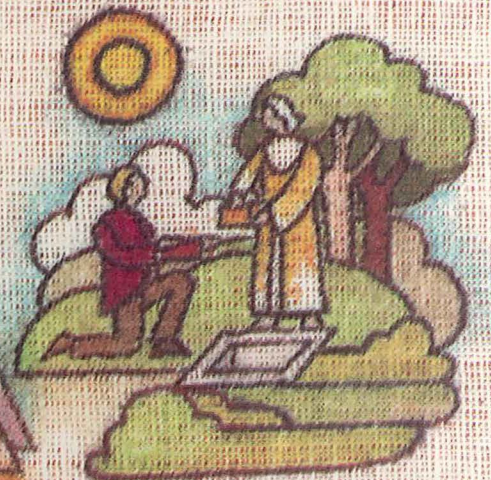
Ri Moroni nuya' ri xaxilej tak k'ana ch'ich' chire ri José Smith. (1827 juna' chirij pe ri ralaxic ri Cristo)