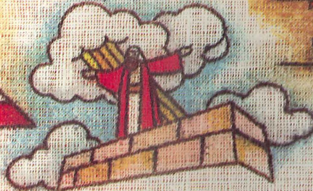
Ri Samuel ri aj Lamani' nutzijoj ri rupetebal ri Jesucristo. (6 juna' tok manjani talex pe ri Cristo)